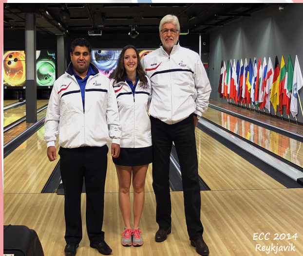
ECC 2014 Reykjavik