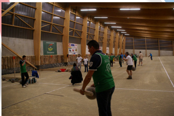
Le quillodrome de Trémouilles avec les joueurs corpo.