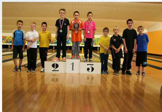
Podium des petits

Extrait du journal de l'Orne du jeudi 2 octobre 2014.