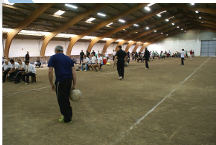
Vue du quillodrome de Trauc