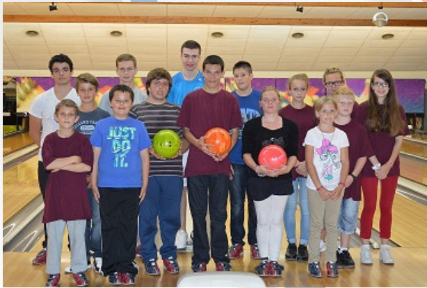
Mat Pour l'Ecole de Bowling de Cherbourg.

En espérant continuer de nombreuses saisons à travailler tous ensemble.