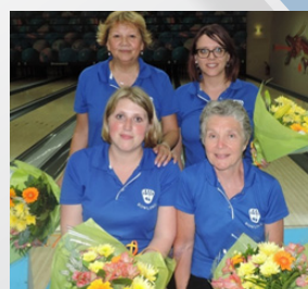
La N3 dames du CSG Gravenchon