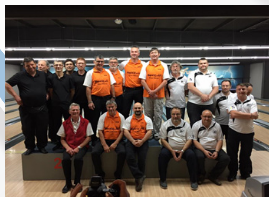
Le podium de la N3E hommes en compagnie de l'arbitre de la compétition