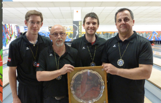
La quadrette vainqueur