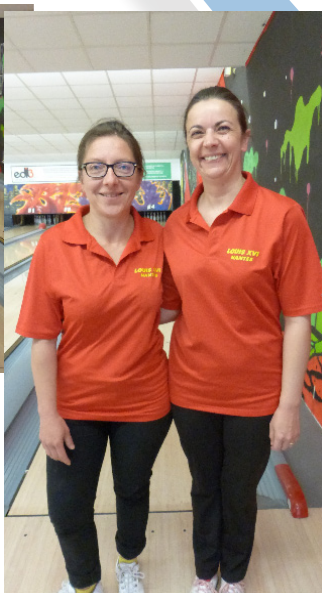
La doublette féminine 1/2 finaliste