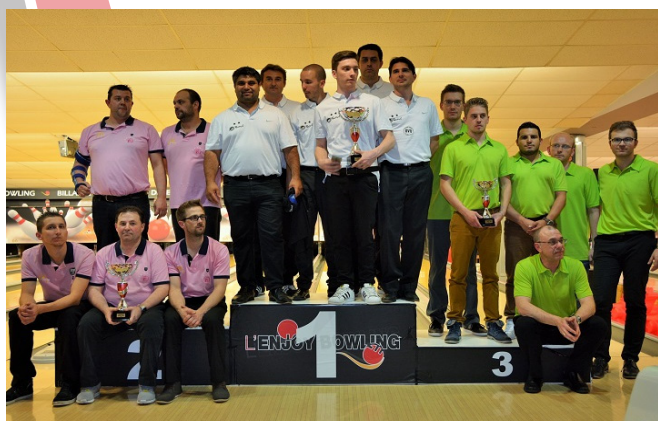
Le podium hommes Nationale 1

Nous remercions ces centres pour leur professionnalisme et leur accueil.