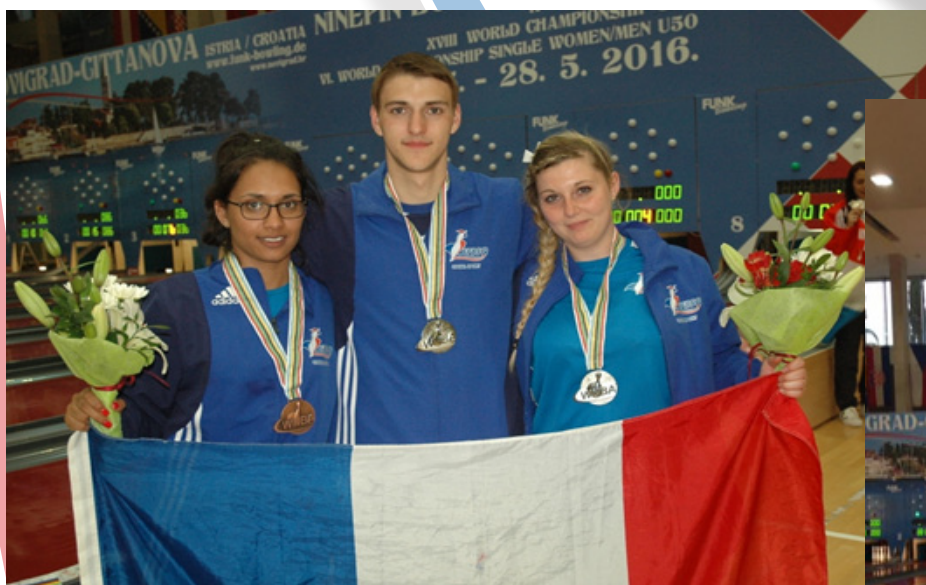
Les trois médaillés juniors