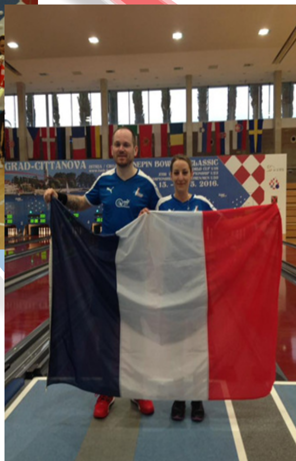
Les deux médaillés seniors