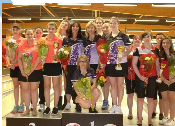
Le podium dames Nationale 1

A ces clubs emblématiques pour certains, nous leur souhaitons une bonne saison 2017 et je suis persuadé que certains feront tout pour remonter en N1.