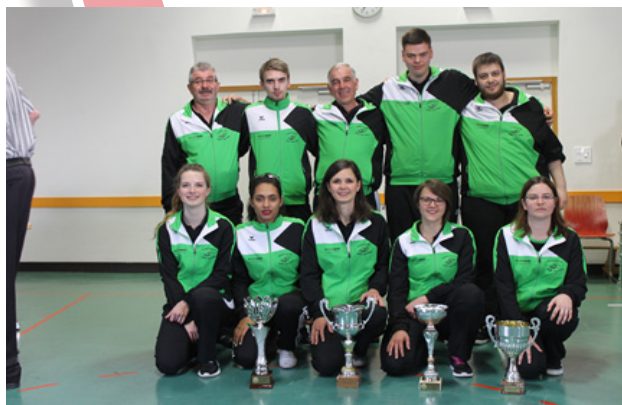
La boule d'or Soultz-sous-Forêts : les deux équipes vainqueurs