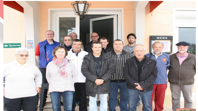
Le groupe d'instructeurs