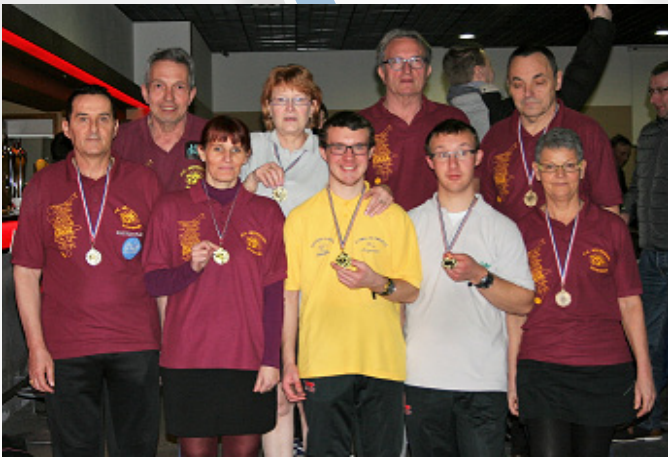
Les médaillés argentais

A l'issue de ces qualifications, seules 8 équipes joueront la grande finale en formule (Round Robin, chacune des équipes rencontrant les autres).