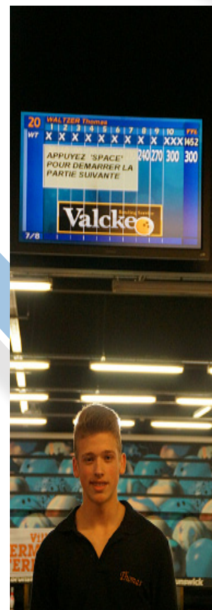
300 - Thomas WALTZER