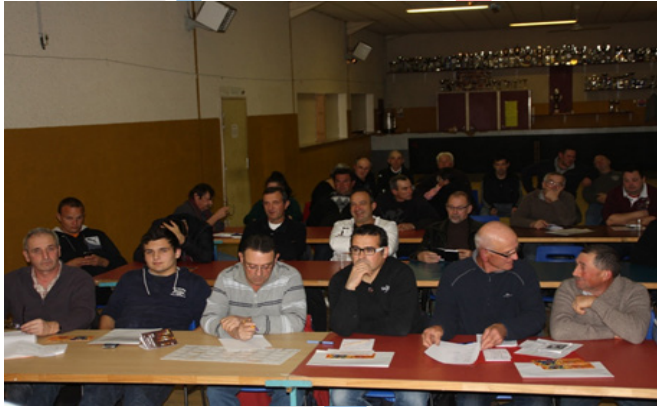
Les responsables lors de la réunion du calendrier

Nous parlerons de l'assemblée générale FFBSQ début mars.