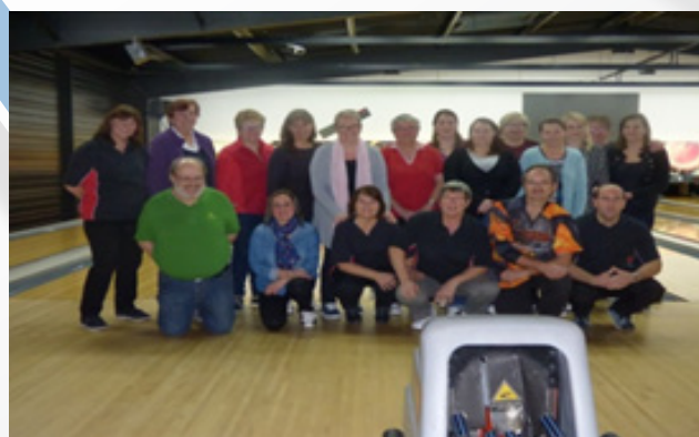
Centre de Barjouville