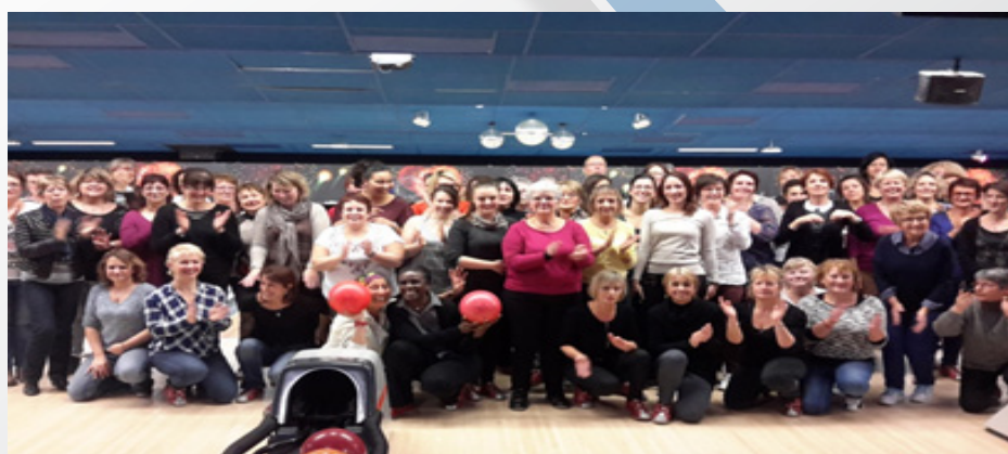
Centre de Saran