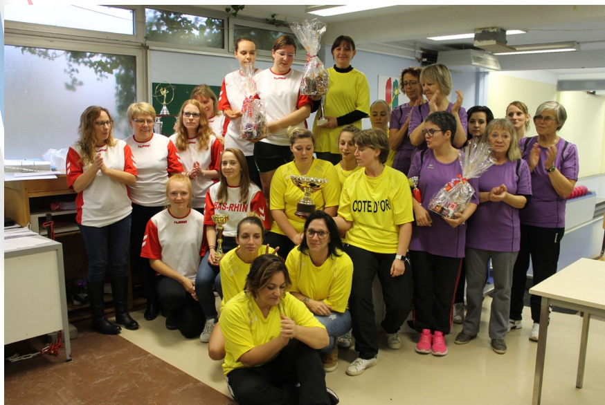
Les 3 équipes sur le podium

Le dimanche 4 novembre 2018 s'est déroulé sur le quillier du complexe sportif de l'Europe à Colmar dans le Haut-Rhin, le traditionnel Challenge des Présidents. Ce challenge regroupe trois équipes féminines, une de chaque département, composées de huit quilleuses. Les six meilleurs résultats sont retenus pour le classement. Cette rencontre a été mise en place pour pallier l'absence de championnat de National 1 féminin.